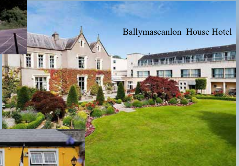
Ballymascanlon House Hotel